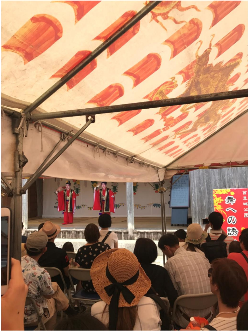
“Hát cung đình”