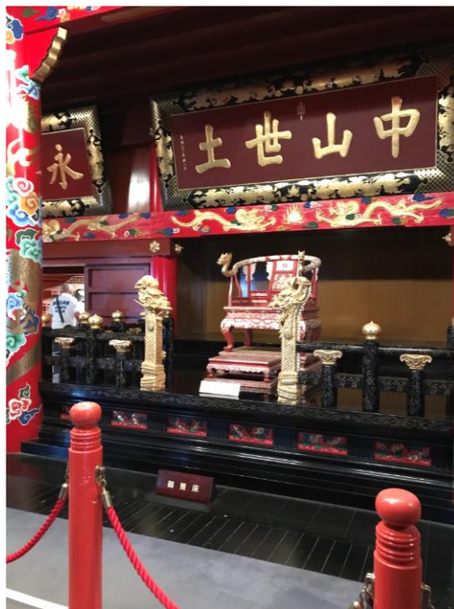
“Ngai vua 2017”