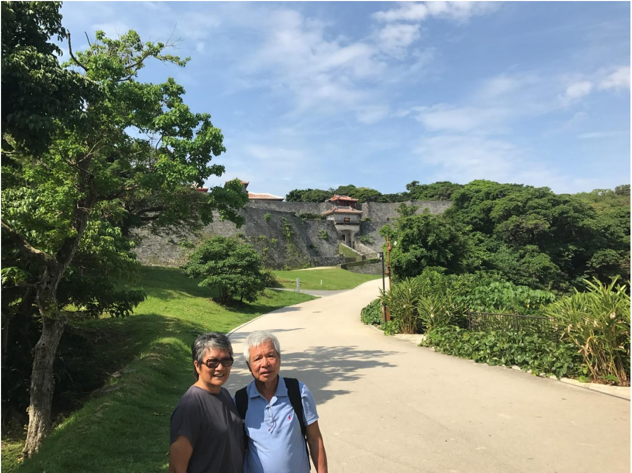
“Bên ngoài tường thành”