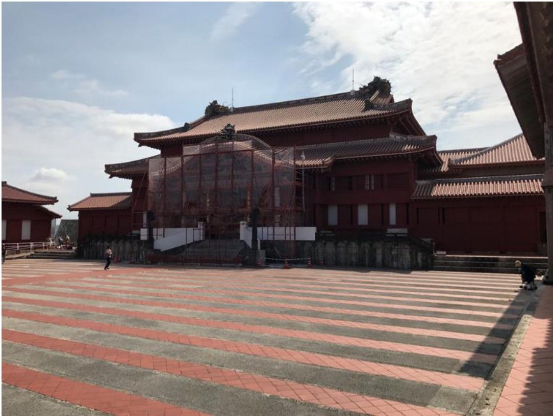
“Chính điện đang hoàn thiện 2017”