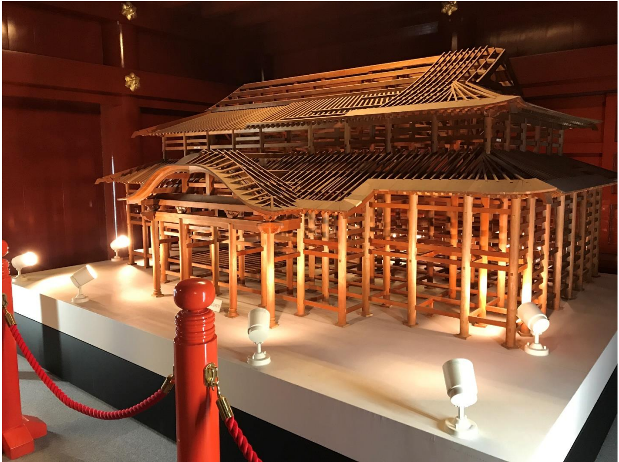
“Mô hình chính điện 2017”

Các khu vực triều chính bao quanh và quay mặt vào quảng trường.