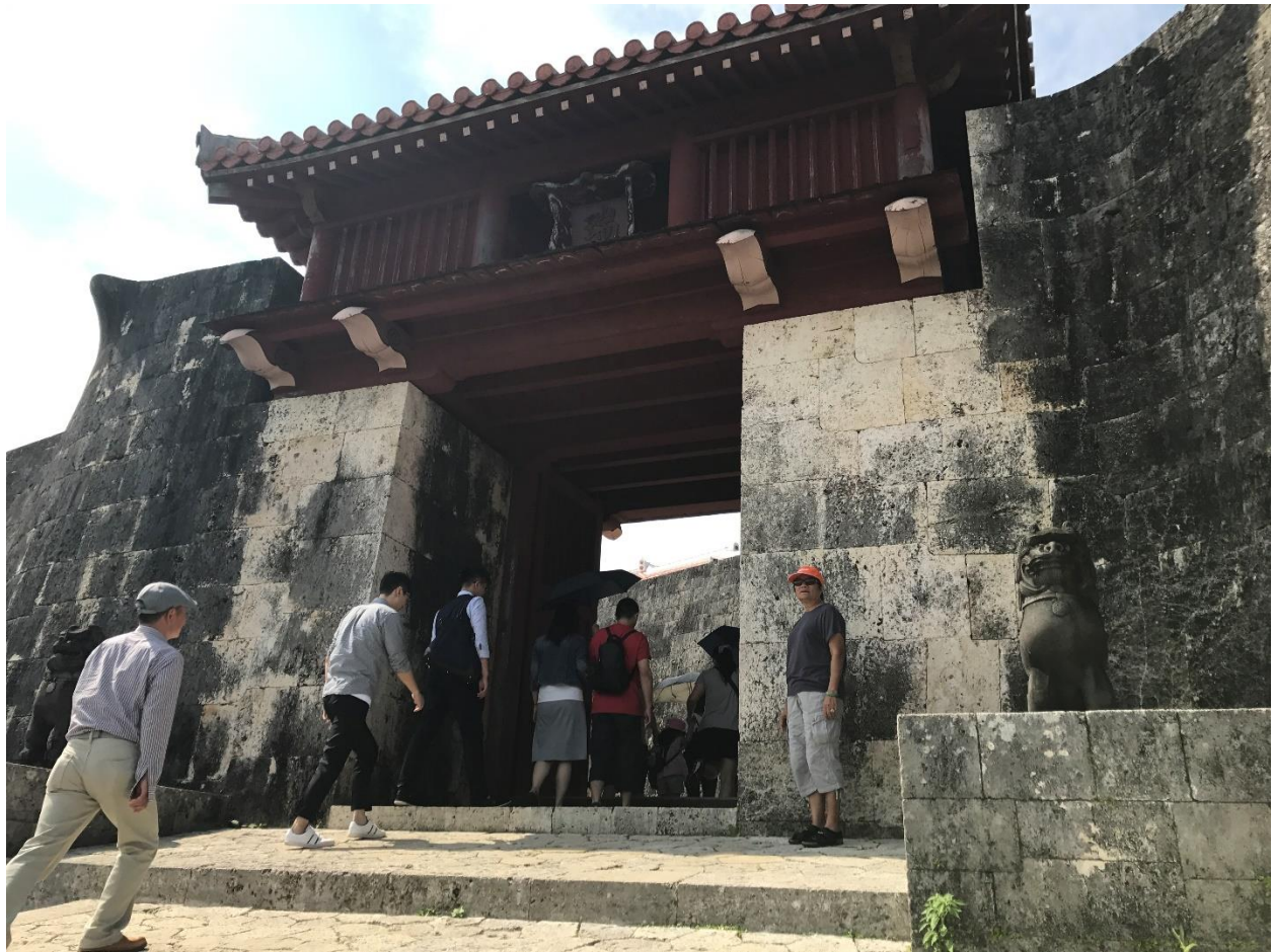
“Cổng phụ” (Cổng bằng đá)