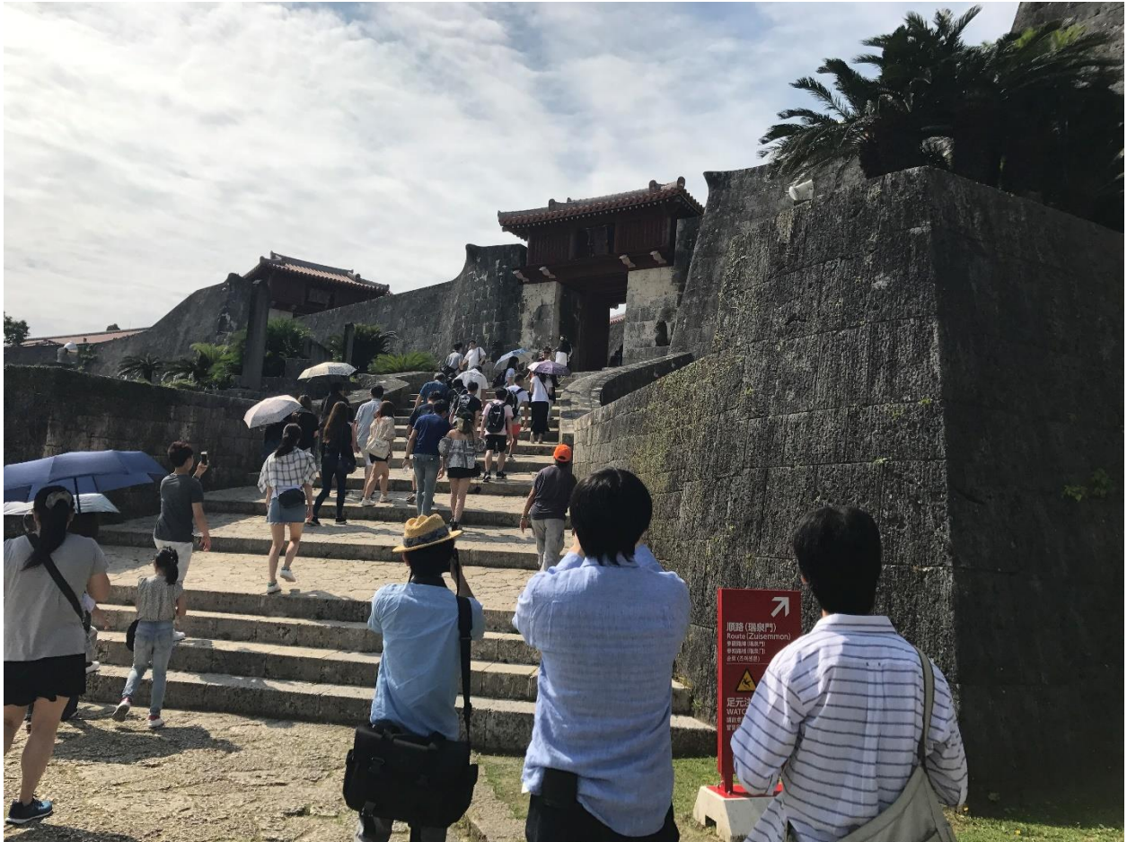
“Lối lên công phụ (công hông)”

Nổi bật ở giữa là tòa chính điện đồ chói, đồ từ mái đến cột, vách. Màu đặc trưng của các cung điện vùng Châu Á: sơn son thếp vàng. Chính điện nhìn ra quảng sân rộng dùng để tổ chức các buổi lễ đại triều..