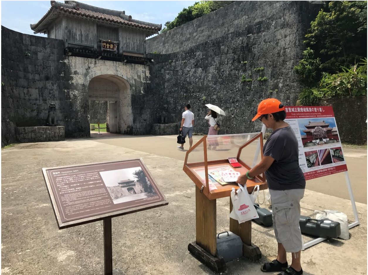
“Cổng chào sau cổng chính” (Cũng là 1 điểm lấy mộc dự thưởng)