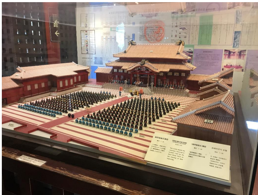
“Sân đại triều”

Các khu vực triều chính bao quanh và quay mặt vào quảng trường.