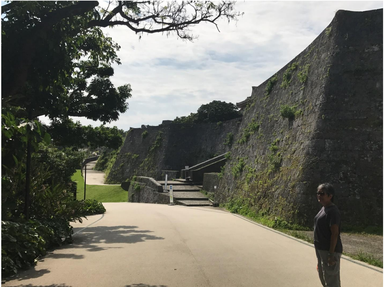
“Bức tường thành bằng đá”

May mắn của vợ chồng người viết và đáng tiếc cho một công trình vừa mới được hoàn thành phục dựng năm 2018, sau nhiều lần bị tan hoang do hỏa hoạn trong quá khứ, và lần mới nhất hầu như bị sàn bằng năm 1945, thời Chiến tranh Thế giới thứ hai.