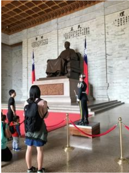
Tượng đồng và lính gác.