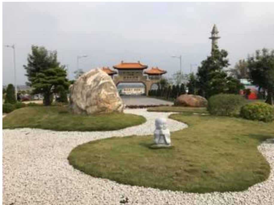
Cổng vào nhìn từ bên trong.

Rạng sang 25/3/2017 cả đoàn thức dậy từ 3giờ để ra phi trường quốc tế Taichung kịp chuyên bay Mandarin Airline cất cánh lúc 7giờ.