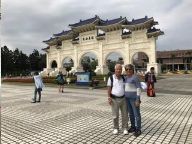
Cổng trước đài Tưởng niệm.

Nghe đâu còn có bảo tàng Cố Tổng thống và bảo tàng quốc gia gần đó, lưu giữ nhiều đồ vật quý giá mang qua từ Mẫu quốc. Nhiều lần Nhà nước Trung cộng đòi lại mà chưa được. Không nhiều thời gian để khám phá khuôn viên rộng 25 hecta này. Hẹn lần sau.