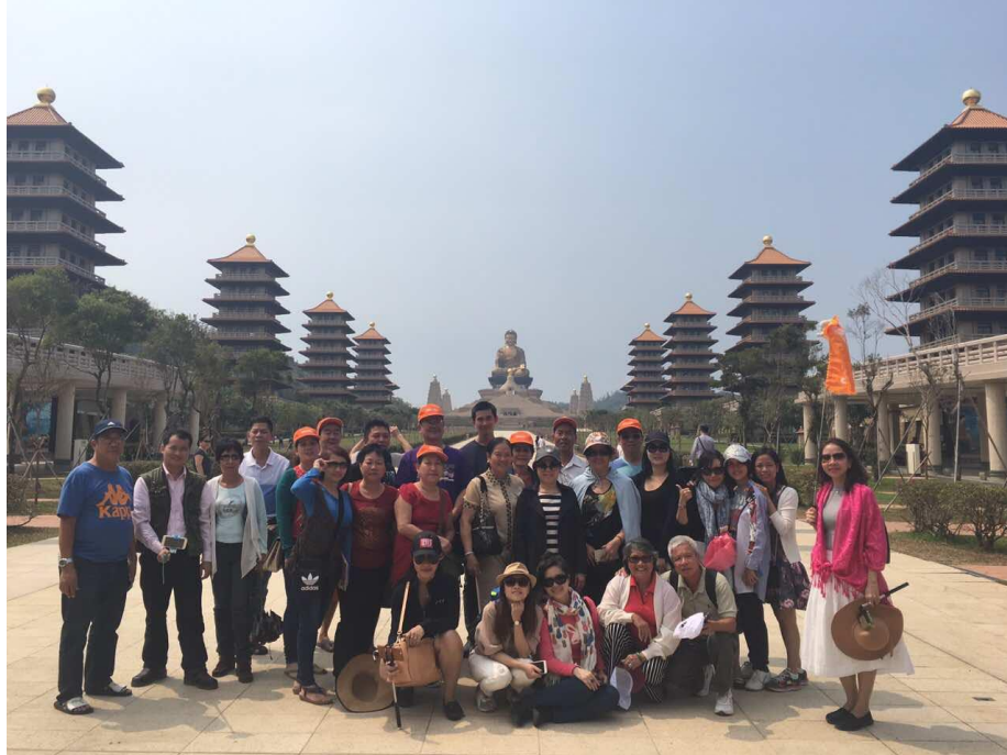
Hình chụp cả đoàn ở Phật Quang Sơn