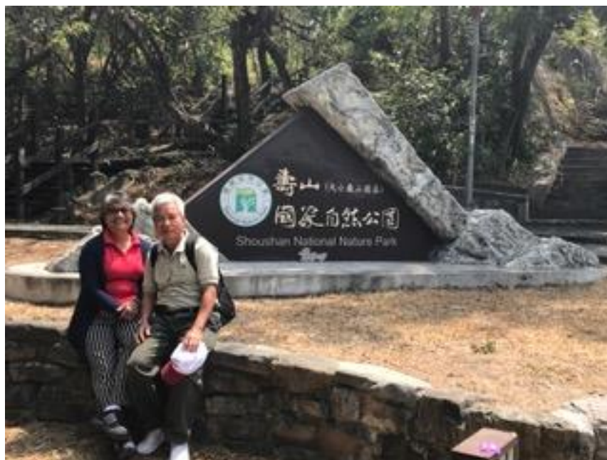
Xuân Thu Các (Shoushan National Nature Park)

Xuất phát từ thành phố Kaohsiung lúc 9h ngày thứ sáu 24/3/2017, sau khi tranh thủ tham quan một vài thắng cảnh khu vực như Xuân Thu Các