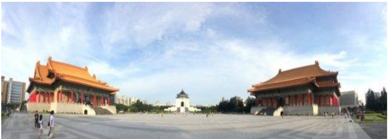
Đài Tưởng niệm nhìn từ cổng trước, tượng đồng đặt trong nhà trắng xa xa.

Tiếp theo tham quan đài Trung Chánh (National Chiang Kai-shek Memorial Hall), nơi tưởng niệm cố tổng thống Tưởng Giới Thạch-vị tướng có tầm quan trọng trong lịch sử hình thành hòn đảo Đài Loan.