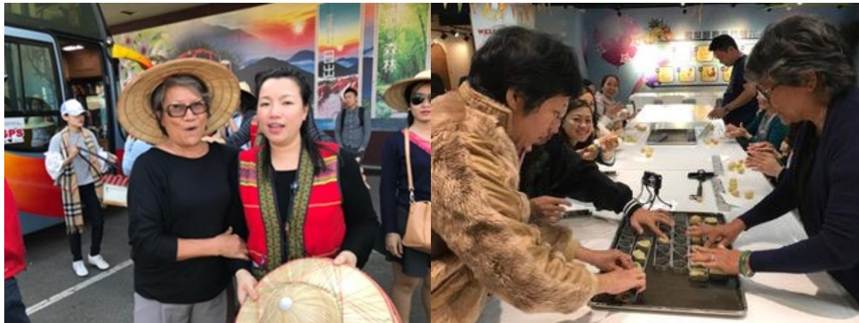
Thủ tay nghề làm bánh dứa ở Cao Hùng

Điểm kế tiếp là cửa hàng trà. Một cô dâu Việt xinh đẹp gốc Hải phòng quảng cáo các sản phẩm trà. Đến đây mới được nghe nhiều công dụng của trà nào là đắp mặt nạ làm đẹp, nhuận trường, bổ mắt,... . Nhiều dạng trà. Trà bột, trà búp, trà Ô long lên men,... Giá trị độ cao (altitude) nơi cây trà sống. Trà được trồng càng cao càng giá trị, giá cả cũng lên theo. Do tầng thấp thu hoạch 4 vụ/năm, vừa vừa 3 vụ/năm, cao chót vót 2vụ/năm. Hiện nay Saigon có món trà sữa Trân châu có lẽ bắt nguồn từ Đài Loan.