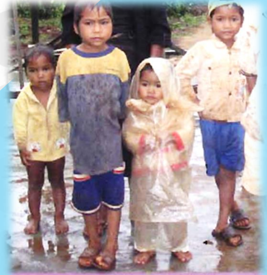
Tương lai các em sẽ về đâu?