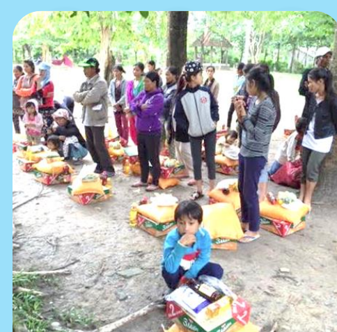
Dân nghèo tại các buôn làng