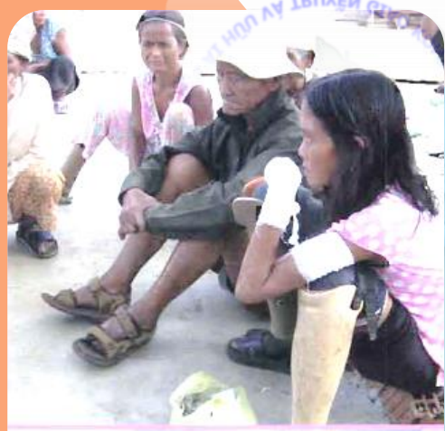
Các bệnh nhân phong cùi